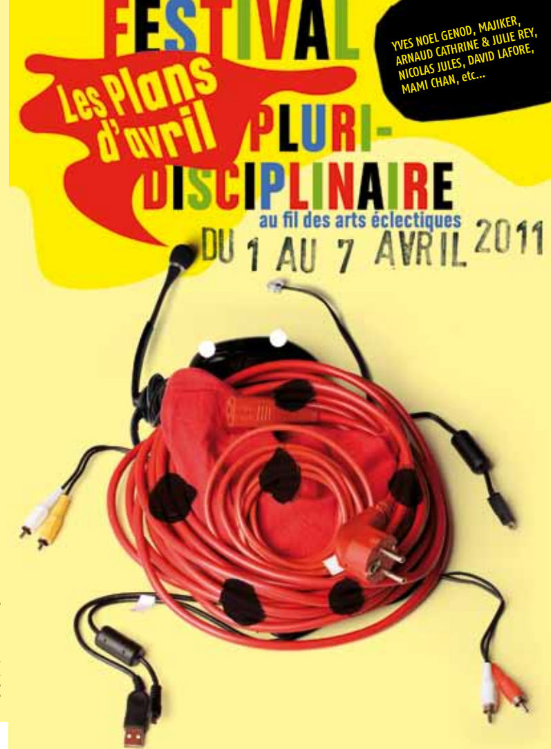
Design graphique : www.cedricgignillon.com © 2011