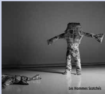
Les Hommes Scotchés