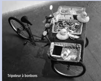
Tripporteur à bonbons

Renan de Germain crée une performance au sein de laquelle s'entremêlent photos et mouvements apportant alors une dimension artistique au yoga.